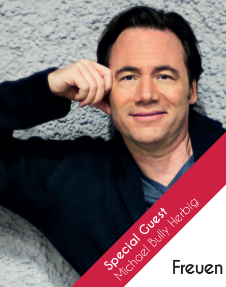
Special Guest Michael Bully Herbig