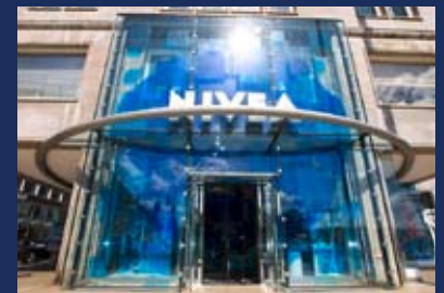
Das Nivea-Haus im Herzen Hamburgs bietet auf drei Etagen Markenerlebnisse pur

Erleben Sie bei Ihrem nächsten Aufenthalt in Hamburg bekannte Marken hautnah. Besonderes Highlight in der Hansestadt ist das an der Binnenalster gelegene Nivea-Haus, das auf drei Etagen Nivea-Pflege pur bietet. Daneben warten in Hamburg u.a. das Frosta Bistro, der Maggi Kochstudio-Treff und das Langnese-Café auf Ihren Besuch. Exklusiv für Sie, unsere MC-BRANDNEWS-Leser, haben wir wieder einen kurzweiligen Markenlehrpfad zusammengestellt. Sehen Sie mit eigenen Augen und erleben Sie mit allen Sinnen, wie Unternehmen ihre Marke inszenieren, und lassen Sie sich für Ihre eigene Markenarbeit inspirieren. In der nächsten MC BRANDNEWS in zwei Monaten folgt der dritte Teil unseres Markenlehrpfads, in dem wir Ihnen sehenswerte Markenstandorte in Köln vorstellen werden. Details zur Markenexkursion in der Hansestadt inklusive Adressen und Routenplan als Download finden Sie unter: www.mc-brandnews.de