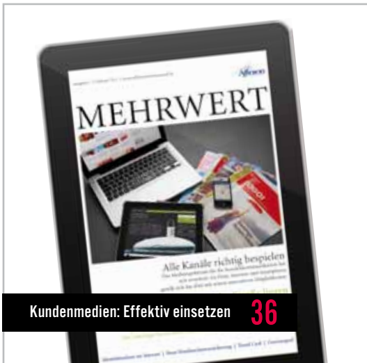
Kundenmedien: Effektiv einsetzen 36