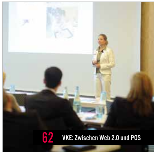
62 VKE: Zwischen Web 2.0 und POS