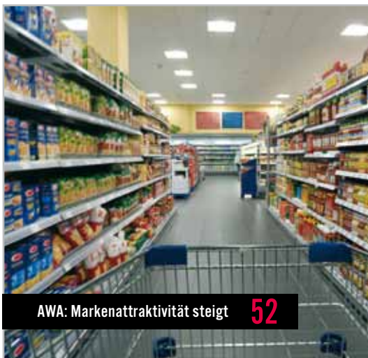
AWA: Markenattraktivität steigt 52