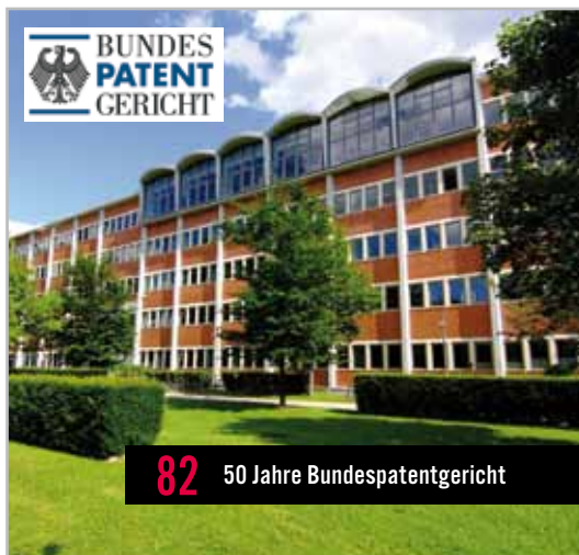
82 50 Jahre Bundespatentgericht