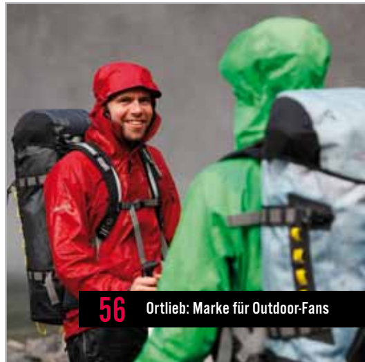
56 Ortlieb: Marke für Outdoor-Fans