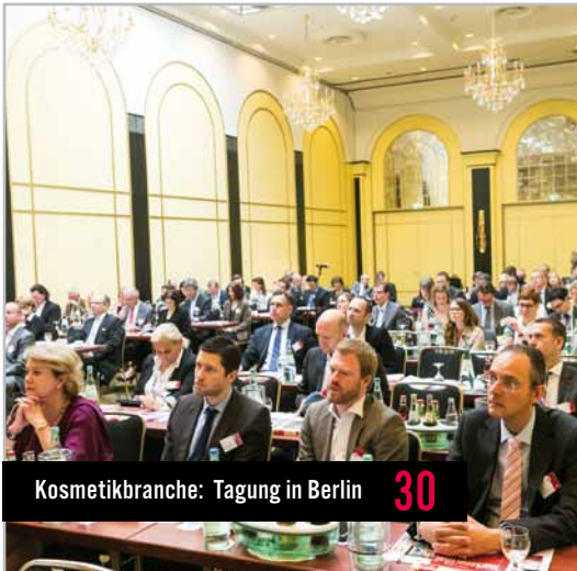
Kosmetikbranche: Tagung in Berlin 30