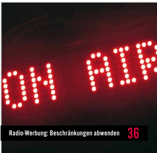
Radio-Werbung: Beschränkungen abwenden 36