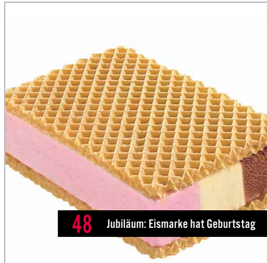
48 Jubiläum: Eismarke hat Geburtstag