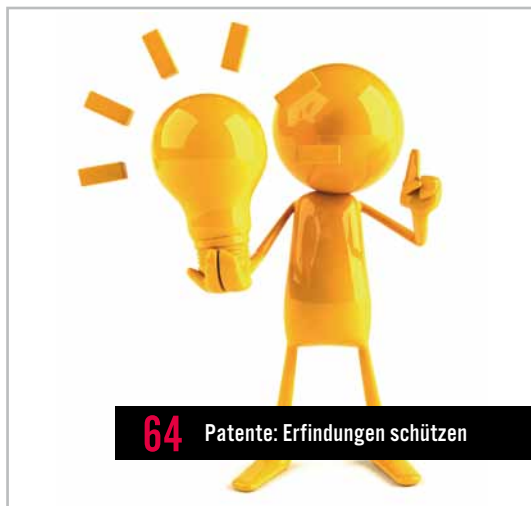
64 Patente: Erfindungen schützen