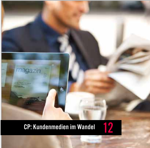
CP: Kundenmedien im Wandel 12